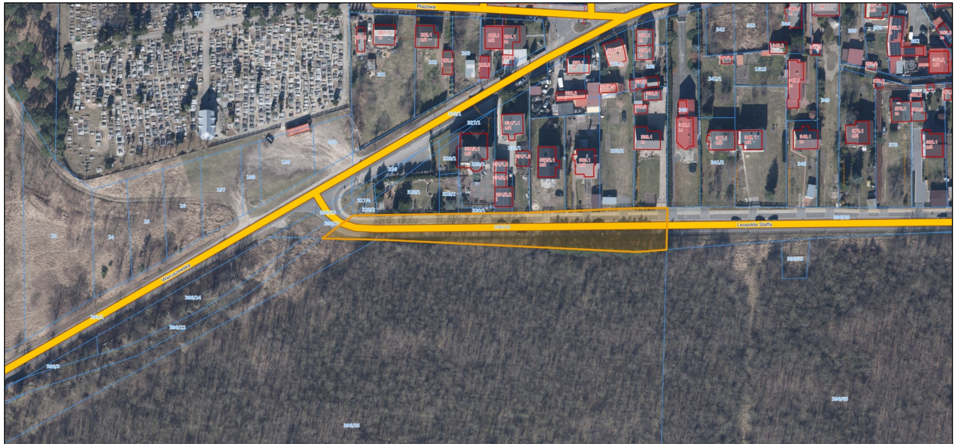
Mapa sytuacyjna w skali 1:500