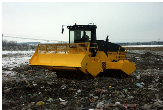
Fot. 4 Składowisko