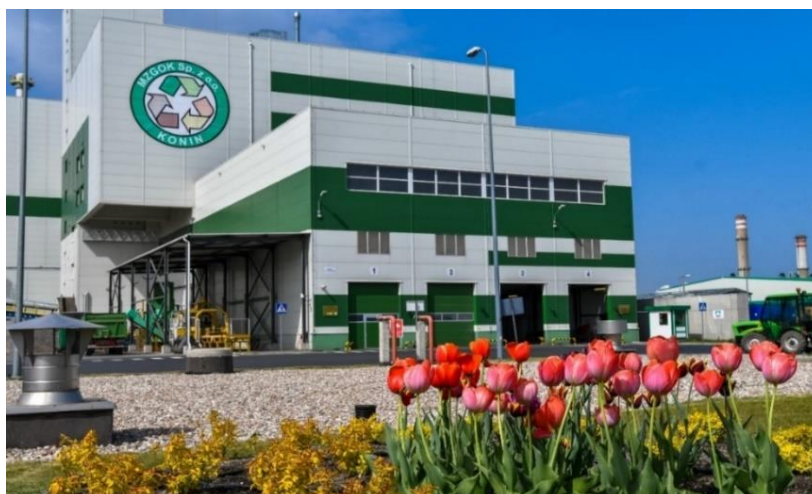
Fot. 6 ZTUOK- widok od strony hali wyładunkowej