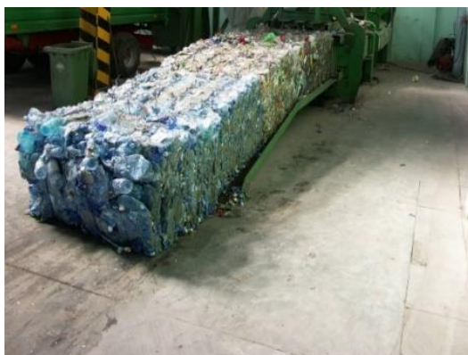
Fot. 1 Sortownia