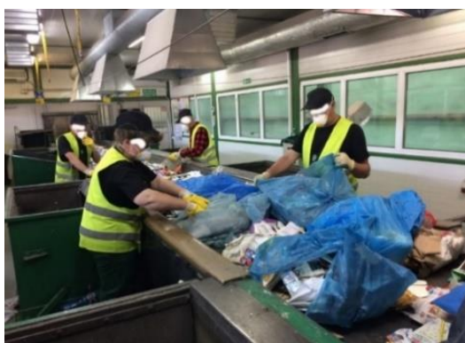
Fot. 2 Linia sortownicza doczyszczania selektywnej zbiórki odpadów