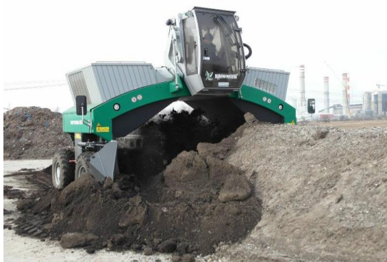
Fot. 3 Kompostownia