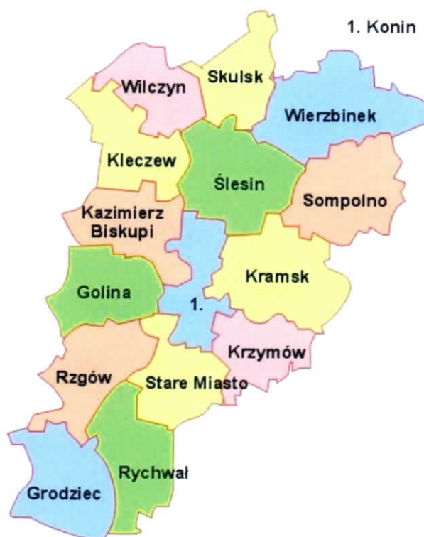
Rysunek 1. Miasto Konin w powiecie konińskim

Miasto Konin zajmuje obszar 82,2 km 2 . Według danych GUS na koniec 2017 roku Miasto liczyło 74.834 mieszkańców, a gęstość zaludnienia to 910 osób/km 2 . Miasto Konin leży w środkowej części powiatu konińskiego.