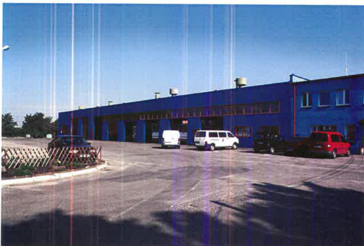
Rys.II.2.1.8. Zajezdnia MZK Konin.

Zajezdnia MZK Konin znajduje się przy ulicy Marii Dąbrowskiej 10 w sąsiedztwie siedziby przedsiębiorstwa. Wyposażona jest w duży utwardzony plac oferujący ok. 80 miejsc postojowych lecz wymagający renowacji oraz 2 budynki obsługi technicznej posiadające 7 kanałów naprawczych, w tym jeden przystosowany do obsługi pojazdów przegubowych, małą lakiernię, magazyn części, biuro i zautomatyzowaną myjnię wymagającą wymiany lub generalnej naprawy. Na terenie zajezdni, znajduje się również główny punkt dyspozytorski, w którym znajdują się centrala sterowania ruchem - wyposażona w odbiorniki GPS dające możliwość lokalizacji poszczególnych autobusów.