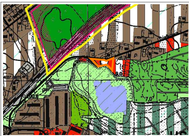
WYRYS ZE STUDIUM UWARUNKWAŃ I KIERUNKÓW ZAGOSPODAROWANIA PRZESTRZENNEGO MIASTA KONINA SKALA 1:10000